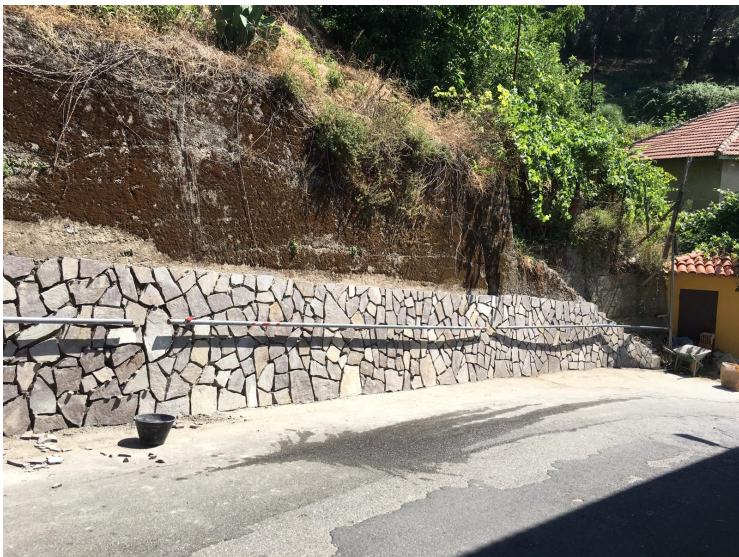
Riqualificazione rione mortaio.