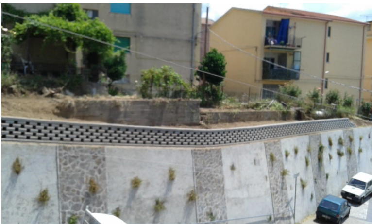
Riqualificazione rione lisciandro.