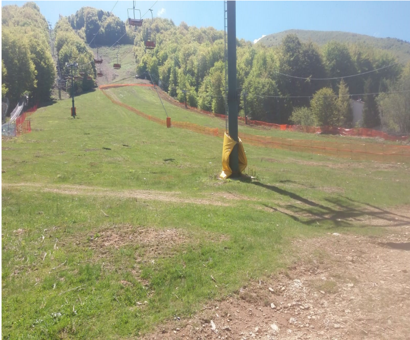
Gambarie, Costruzione pista da scii Artificiale.