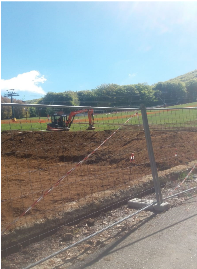
Gambarie, co- struzione cam- po polivalente presso gran discesa.