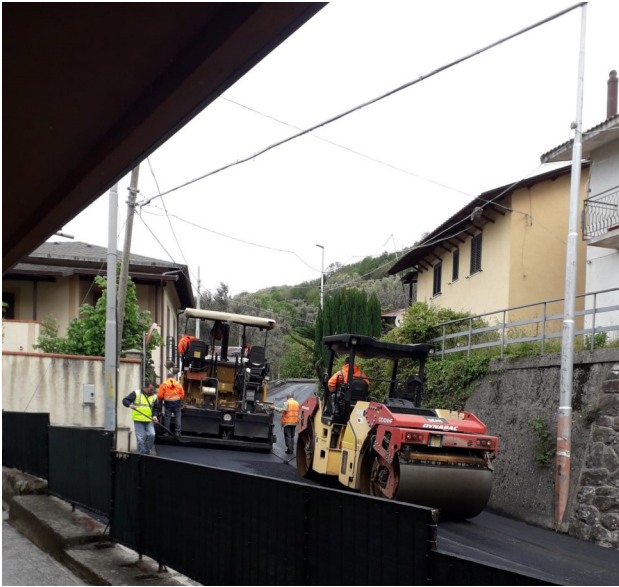
Riqualificazione del manto stradale.