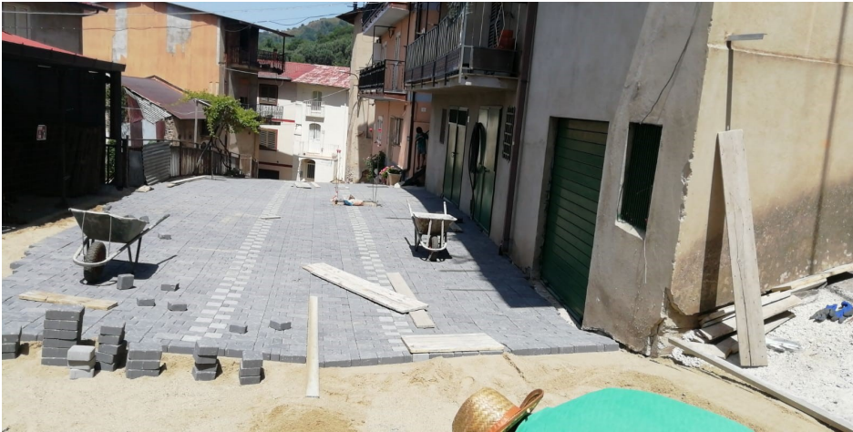
Riqualificazione rione campo.