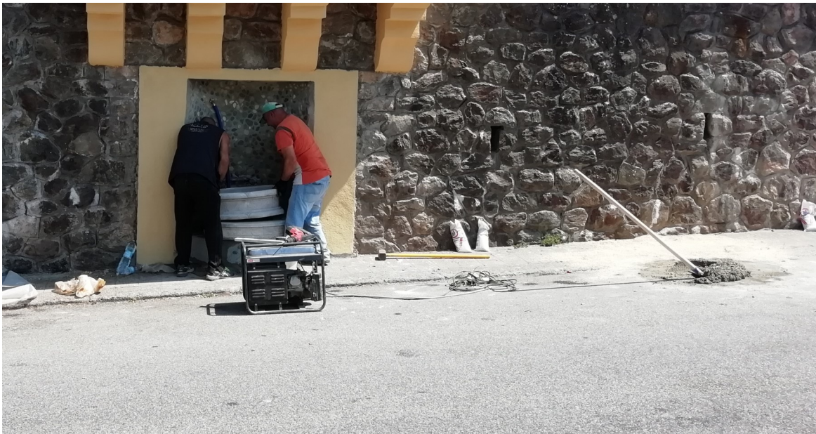
Riqualificazione fontana ex asilo monumentale.