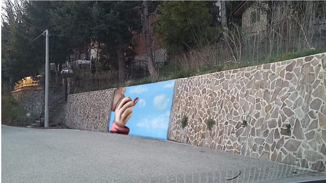
Murales per arredo urbano.