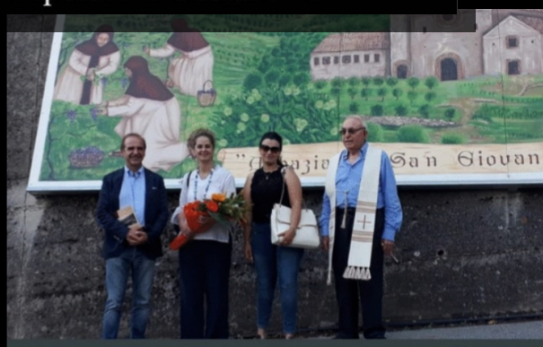
Inaugurazione del Quadro raffigurante l’Abbazia di San Giovanni in Castaneto dell’ XI° secolo