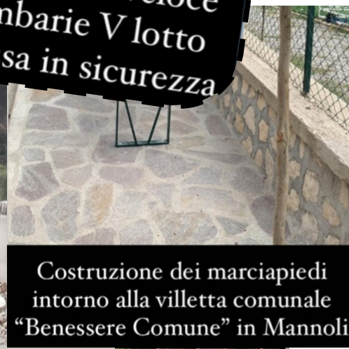
Costruzione dei marciapiedi intorno alla villetta comunale "Benessere Comune" in Mannoli