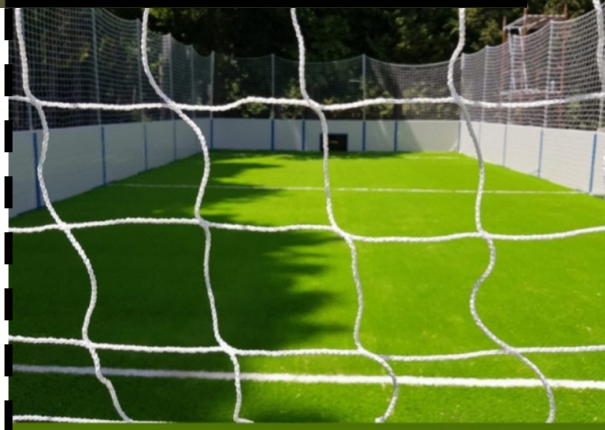
Nuovo campo di Volta football a Cucullaro