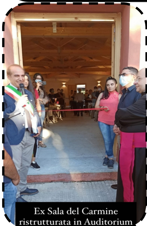
Ex Sala del Carmine ristrutturata in Auditorium