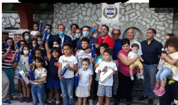
Distribuzione borracce termiche in acciaio inox ai bambini del Plesso scolastico di Santo Stefano