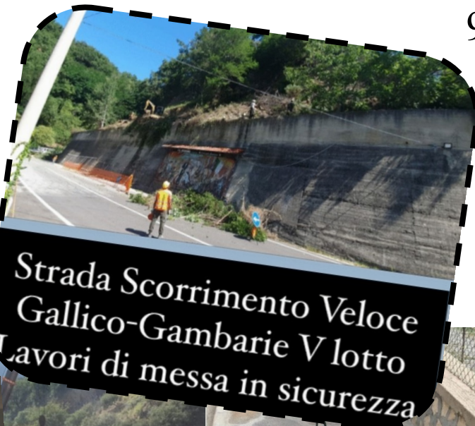
Strada Scorrimento Veloce Gallico-Gambarie V lotto Lavori di messa in sicurezza