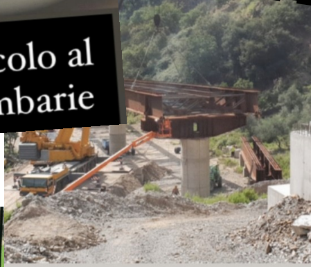
Strada Scorrimento Veloce Gallico-Gambarie III lotto Costruzione Viadotto San Giorgio