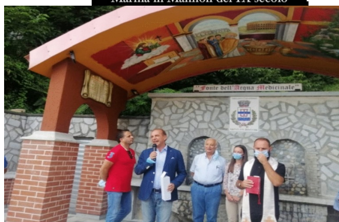
Rinnovata la Fonte dell’Acqua Medicinale con la storia di San Silvestro che battezza l’imperatore Costantino