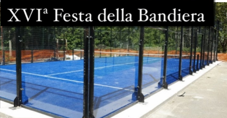
Nuovo campo di Padel a Cucullaro