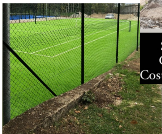
Rinnovato campo di tennis in erba sintetica a Cucullaro