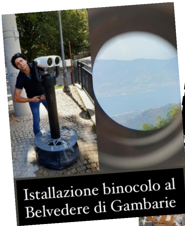
Istallazione binocolo al Belvedere di Gambarie