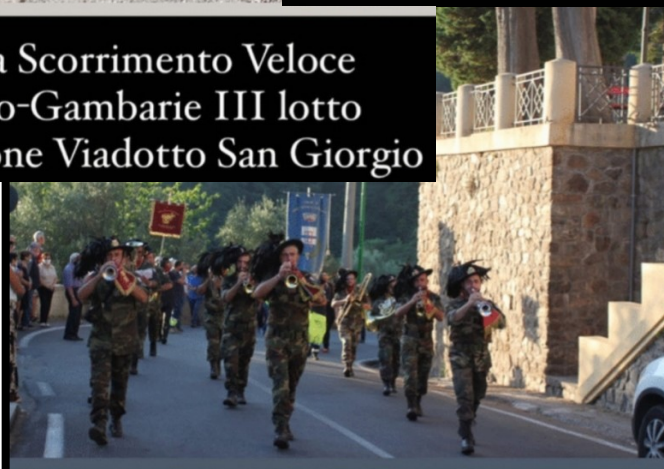
XVI a Festa della Bandiera