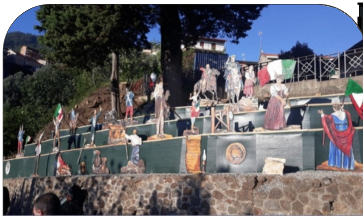
“Venti di storia” dal 29 agosto 1847 al 7 novembre 1860. Ingresso a Napoli di Vittorio Emanuele II e di Elisabetta Romeo sventolante il Tricolore